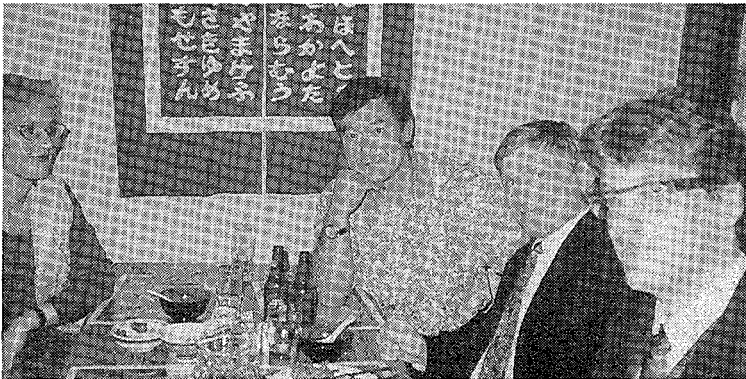
写真3 パーティではくだけた会話が必要となる。でも仲々々…。

私が日本語を話している時の自分の内面と英語を話している時の自分の内面との違いについて、多少ながら実感出来るようになってきているというその内容は、今の処、以上である。