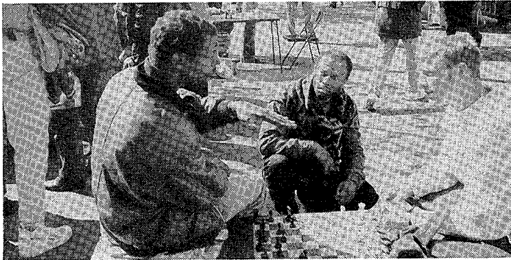
写真2 賭けチェスのプロ達。何を話しているのかサッパリ分からなかった。

ここに思いを馳せるとき、単に英語の言い回しを暗記しろ、と言われる前に、私としては、ヒトに言語表現を行わせる背景、即ち、心の根のほうを考える必要性を感じてしまうのだ。ここではそこを覗いてみたい。