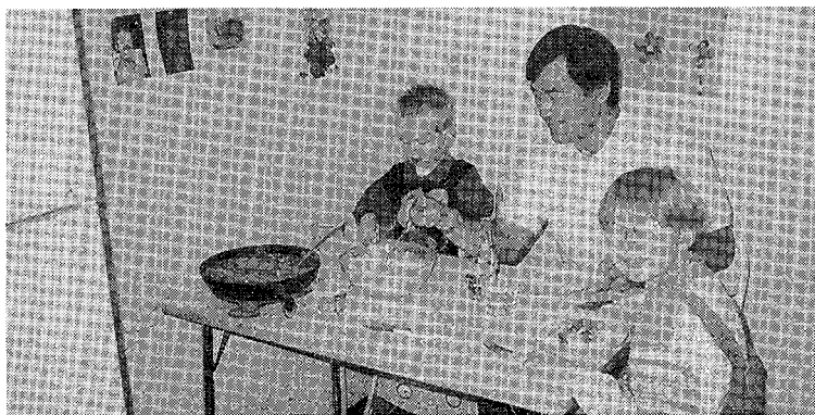
写真5 こういう時が一番辛い。うまいかうまくないか 位しか言えないからだ。あとはサッパリ不明……。

自由と民主主義を獲得した民の操る言語、英語。日本人の心根(ころね)を持つ私にとって、その英語習得の風は今尚、遠くを吹き、しかも頬に感じるのは、その習得をせせら笑うが如き向かい風なのである……。