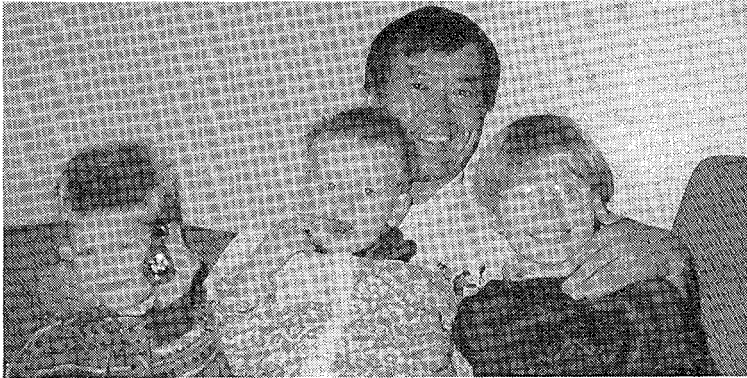
写真4 子供との会話が一番疲れる。しかし、楽しい。

以上の①～⑤が如何なる組合わせかは知らず、時に混合、時に化合して、私の日本語表現の背景を司っている様である。ここではこれを私が日本語を話しているときの心の裡なる背景、私の日本語表現の際の心根（こころね）と措定しておく。そしてこの心根（こころね）が話す英語の習得を失敗させて来ているのだ。